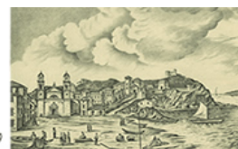
Golfo di Ponente nel 1700