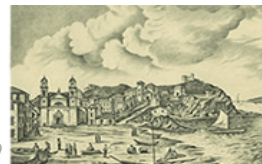
Golfo di Ponente nel 1700