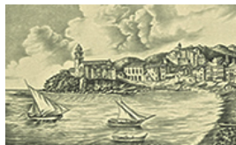
Golfo di Levante nel 1700